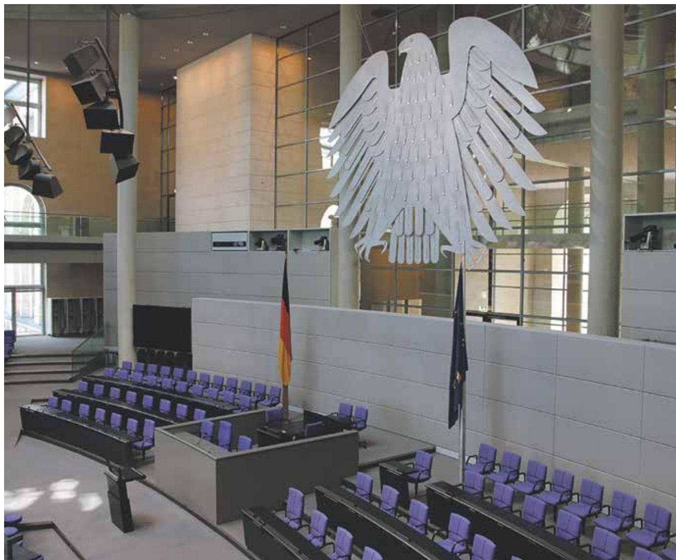
Piotr Biernacki

Podczas sesji Rady Gminy Miedźno w dniu 30 listopada radni przyjęli apel do ministra spraw zagranicznych i poparli rządowe działania w sprawie reparacji, odszkodowań i zadośćuczynienia z tytułu strat, jakie Polska poniosła z powodu napaści Niemiec w 1939 roku. Dokument odnosi się także do wojennej okupacji miejscowego samorządu.