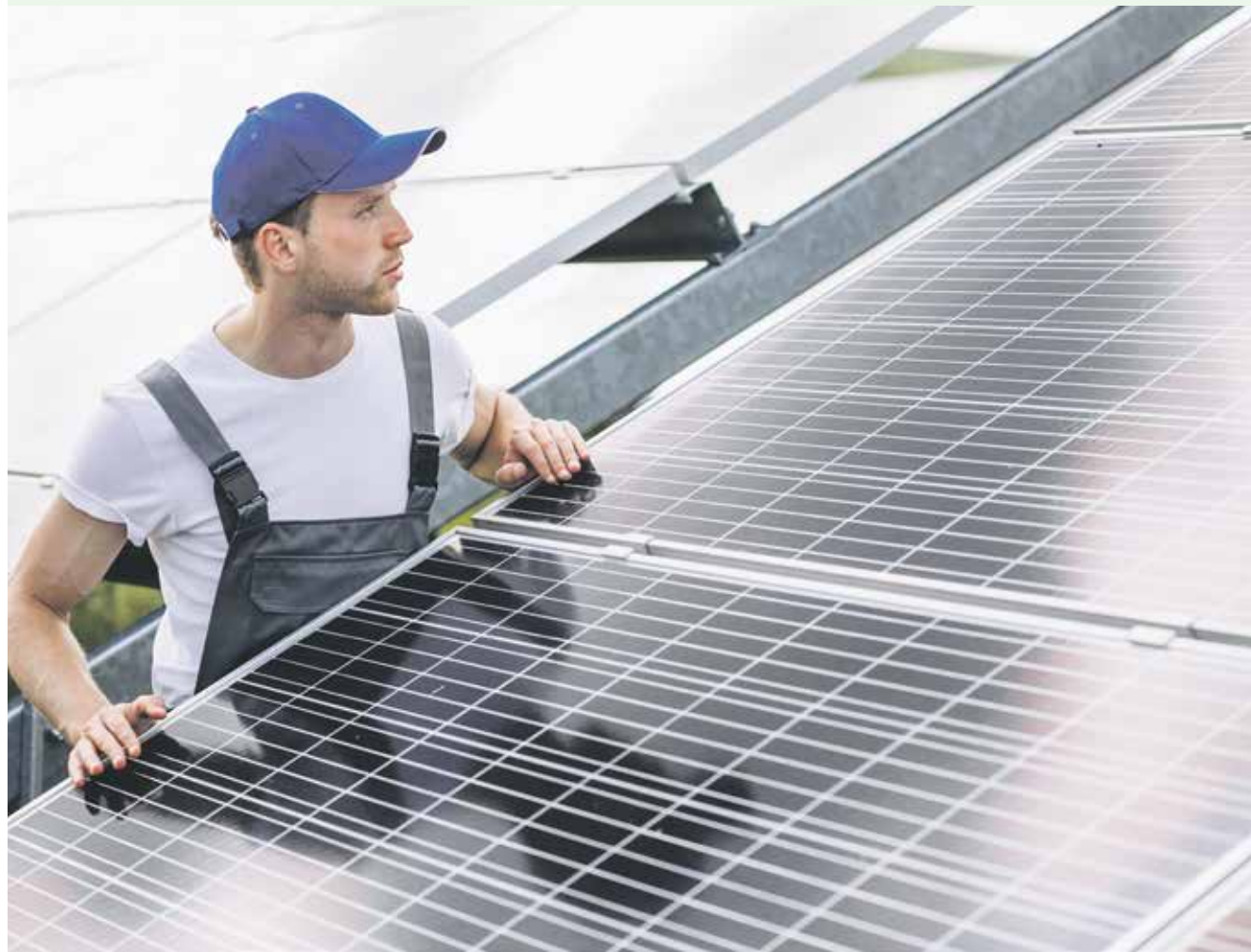
Piotr Biernacki

15 lipca Ministerstwo Klimatu i Środowiska ogłosiło start szóstej edycji programu „Mój Prąd”. Nabór wniosków rozpocznie się 2 września i potrwa do 20 grudnia bieżącego roku lub do wyczerpania alokacji. Program, z budżetem wynoszącym 400 mln zł ze środków FEnIKS, ma na celu wspieranie rozwoju mikroinstalacji fotowoltaicznych w Polsce. Zgodnie z wytycznymi programu okres kwalifikowania wydatków obejmie czas od 1 stycznia 2021 roku.