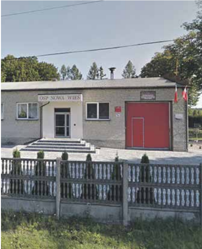
Piotr Biernacki, fot. Google Maps

W Nowej Wsi rozpoczyna się modernizacja mająca na celu poprawę warunków technicznych oraz zwiększenie efektywności energetycznej budynku ochotniczej straży pożarnej. Projekt termomodernizacji, którego wykonawcą jest spółka Fargo Invest z Częstochowy, zakłada przeprowadzenie wielu prac budowlanych. Łączny koszt przedsięwzięcia wyniesie niewiele ponad 390 tys. zł.