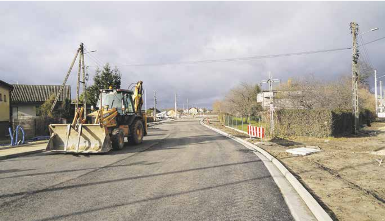
Monika Wójcik, fot. Urząd Miasta i Gminy Koniecpol

Kontynuowane są prace modernizacyjne na drodze wojewódzkiej DW 786, od przejazdu kolejowego w Koniecpolu do granicy województwa śląskiego. Choć kilka tygodni temu zakończono je na dwóch odcinkach, inwestycja, jak zapowiadał wcześniej burmistrz Ryszard Suliga, nie zwalnia tempa. 22 listopada upłynął ogłoszony przez Zarząd Dróg Wojewódzkich w Katowicach termin składania ofert na realizację trzeciego etapu tej ważnej inwestycji.