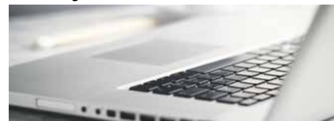
Piotr Biernacki, fot. Freepik

Placówka została wyposażona w ramach działań wspierających cyfrową transformację edukacji, realizowanych ze środków Krajowego Planu Odbudowy.