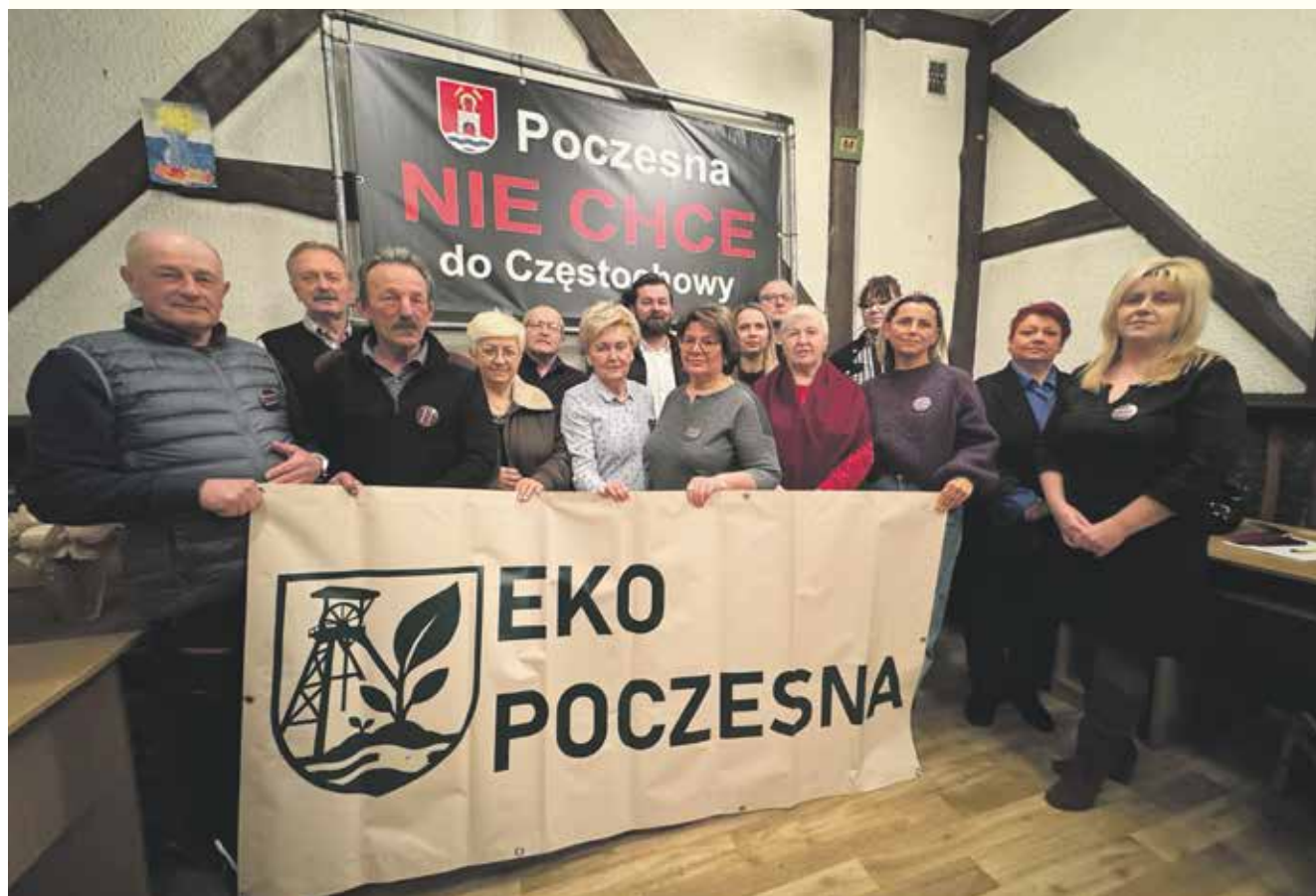
Piotr Biernacki, fot. Piotr Biernacki

Radni i społecznicy z gminy Poczesna zapowiadają referendum, ostrzegając przed wielomilionowymi stratami i wskazując na kulisy sporu wokół wysypiska w Sobuczynie. W tle pojawiają się ogromne pieniądze, zarzuty o brak analiz i pytania o polityczne naciski. O najbardziej palącym obecnie problemie w gminie rozmawiamy z działaczami Stowarzyszenia Eko Poczesna.