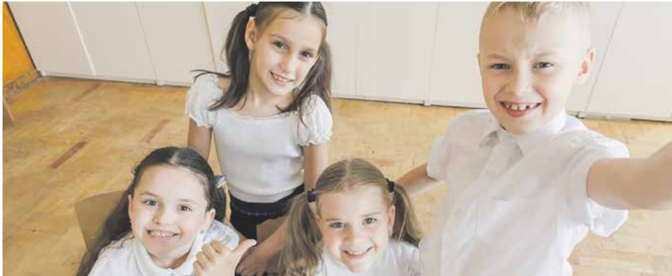
Monika Wójcik

Urzednicy z Kłobucka opublikowali szczegółowe zasady i harmonogram rekrutacji do klas pierwszych szkół podstawowych na przyszły rok szkolny. Nabór prowadzony będzie zarówno dla dzieci zamieszkałych w obwodzie danej szkoły, jak i dla kandydatów spoza obwodu. Kluczowy etap postępowania przypadnie na marzec, a ostateczne listy przyjętych uczniów zostaną ogłoszone w drugiej połowie kwietnia.