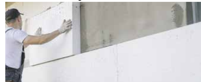
Piotr Biernacki, fot. Freepik

W gminie Janów etap zapowiedzi właśnie ustąpił miejsca konkretem. Samorząd rozstrzygnął postępowania przetargowe dotyczące czterech zadań obejmujących szkoły podstawowe w Piasku, Lusławicach i Lgoczance oraz świetlicę wiejską w Lipniku. Z dokumentów przetargowych wynika, że łączna wartość wybranych ofert to 7,18 mln zł. Tyle właśnie gmina zamierza uruchomić na poprawę efektywności energetycznej, standardu technicznego i codziennego komfortu użytkownika ważnych obiektów publicznych.